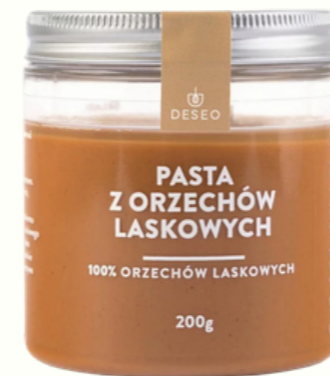
PASTA Z ORZECHÓW LASKOWYCH 100%