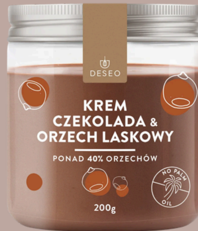
KREM CZEKOLADA & ORZECH LASKOWY