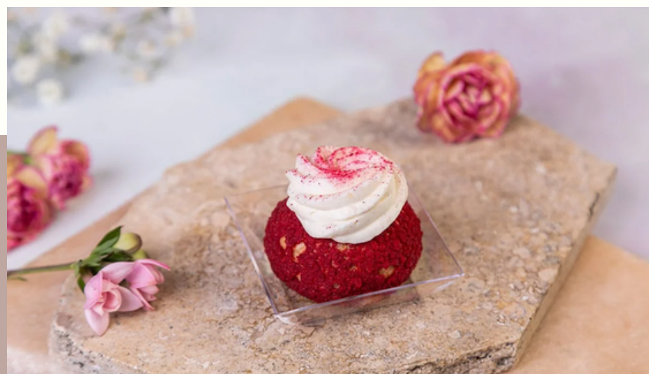
MINI PŁYŚ SUMMER