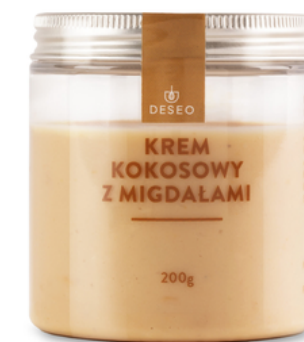
KREM KOKOSOWY Z MIGDAŁAMI CRUNCHY