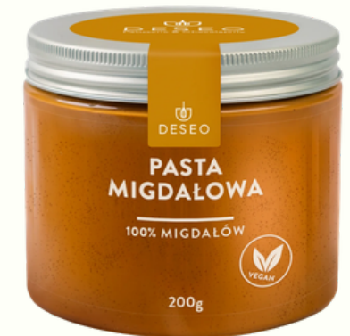
PASTA MIGDAŁOWA 100%