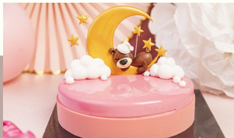
TORT NA BABY SHOWER