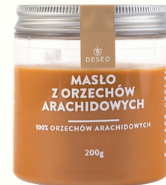
MASŁO Z ORZECHÓW ARACHIDOWYCH 100%