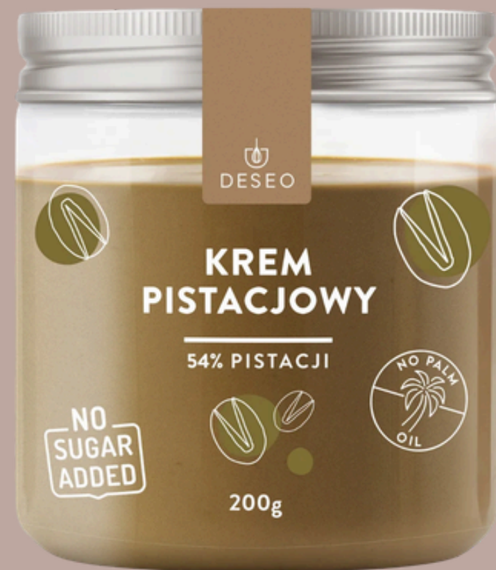
KREM PISTACJOWY 54% BEZ CUKRU