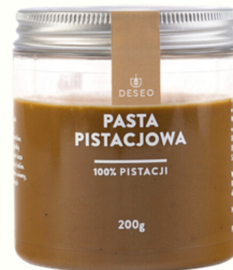
PASTA PISTACJOWA 100%

PASTY 100%, KREMY ORZECHOWE, PRALINY 200 G