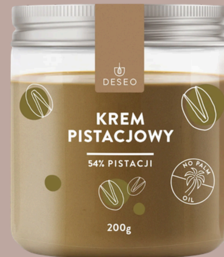
KREM PISTACJOWY 54%