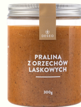
PRALINA Z ORZECHÓW LASKOWYCH