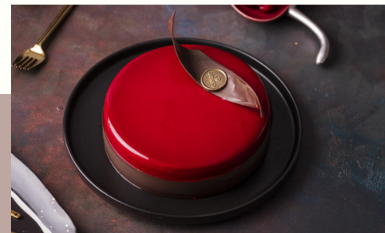
TORT CHERRY LADY