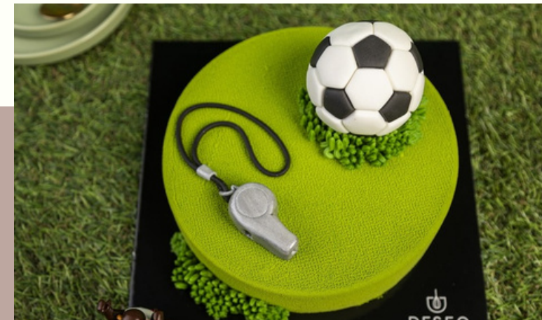
TORT PIŁKA NOŻNA