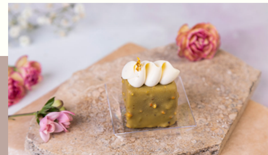
MINI PISTACHIO CHEESECAKE